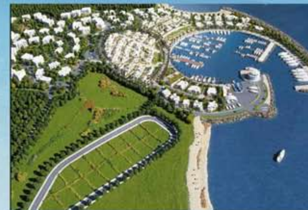
6-7min från Resorten finns det nya Gammarth marina