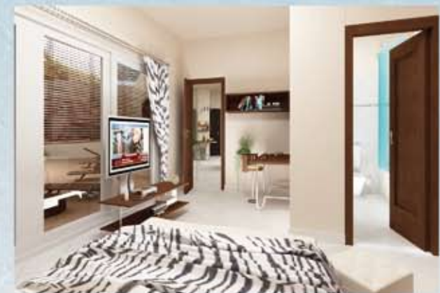
Sovrum med balkong och tillgång till eget badrum