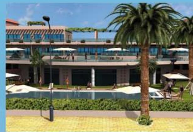
Översiktlig och solrik fasad