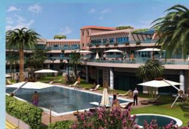
Sol och restaurang terrasserna med swimmingpool utsikt