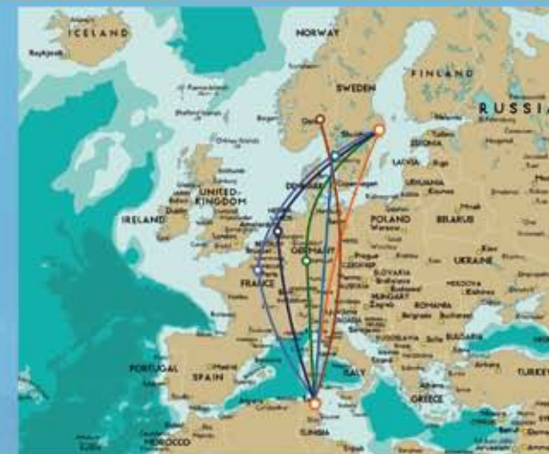
Många flygmöjligheter, den kortaste tar mindre än 4 timmar

Tunisien satsar starkt på skola och utbildning. Många är förvånade över den höga utbildning som dagens Tunisien har. Detta tack vare en medveten satsning på utbildning. Inom hälsosektorn har det genomförts en tyst revolution de sista åren. Carthage Resort har två läkare i sin stab og vet vilka knapper det skal tryckes på om helsevesenet her hjemme ikke får bilen i gir.