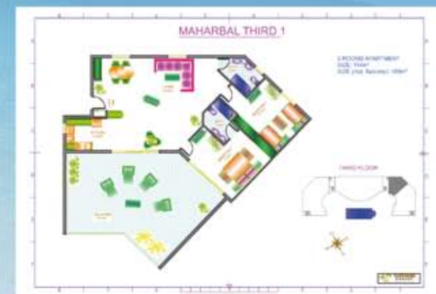
Bekvämt och praktiskt