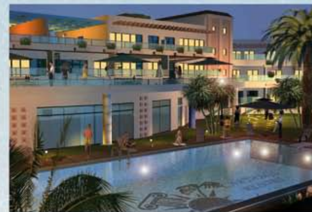
Trevligt poolområde med trädgård