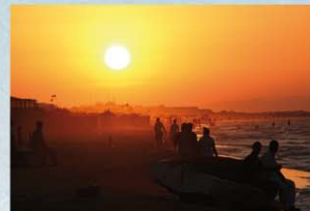
Solnedgång på stranden i Gammarth