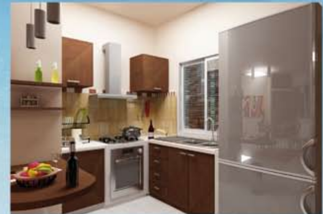
Modernt och fullt möblerat kök