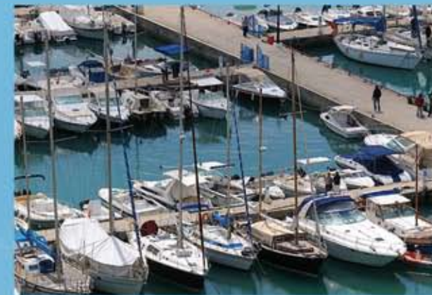
Till den storslagna marinan i Sidi Bou Said är det bara 15mn

Anläggningar såsom vatten land, nöjesparker och djurpark finns på andra sidan staden men inom ett avstånd av 15-20 minuter från Carthage Resort. Sidi Bousaid Marina och Gammarth Marina ligger i närheten av Carthage Resort.