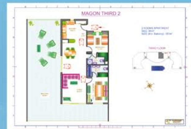
Lägenheterna är handikappvänliga

Vissa lägenheter har egen parkering och förvaringsbox i källaren. Vilken av dessa det är framgår av översikten i lägenheterna som finns på vår hemsida.