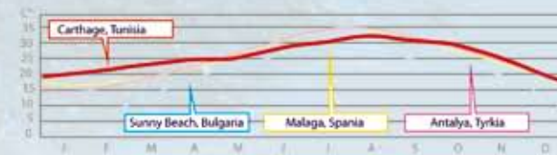
Ett mycket stabilt och gott klimat