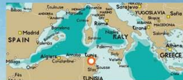
Tunis ligger centralt- vid medelhavet