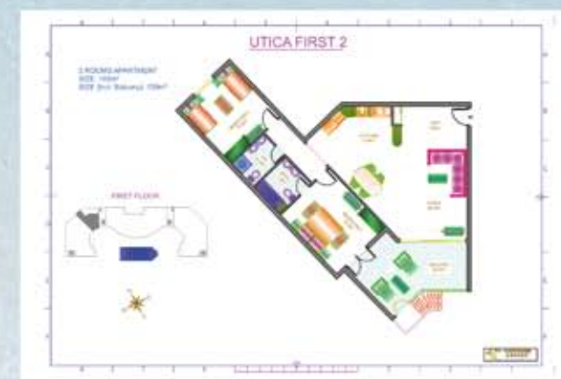
Direkt tillgång till trädgården från terrasserna på första våningen